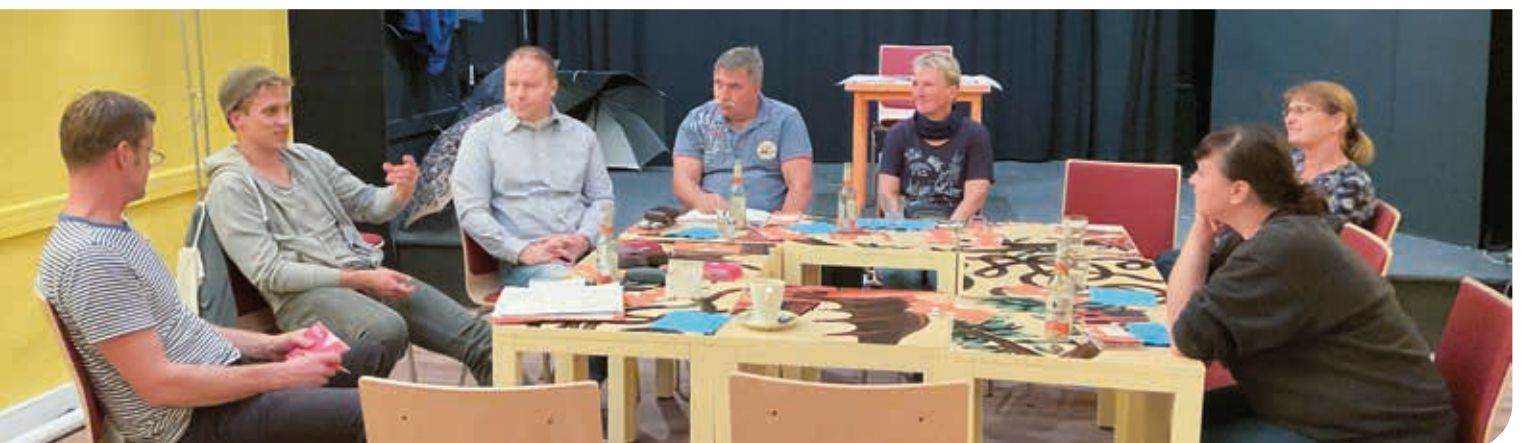
Regionalgruppen- treffen im Jugendstaats- theater Parchim

Ein Abend ganz im Zeichen des Theaters, dazu waren die Mitglieder der Regionalgruppe Ludwigslust-Parchim im Vorfeld ihrer Wahlveranstaltung eingeladen. Uns erwartete ein informatives Gespräch mit der Dramaturgin und