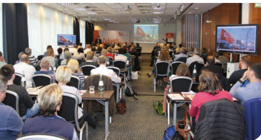
Der Landesverbandstag 2019 in Rostock

Der Hauptvorstand des VBE-MV hat für den 14. und 15. April 2023 den 12. Landesverbandstag einberufen. Der Landesverbandstag ist das höchste Beschlussgremium des VBE-MV und tagt turnusmäßig alle vier Jahre. Auf die-