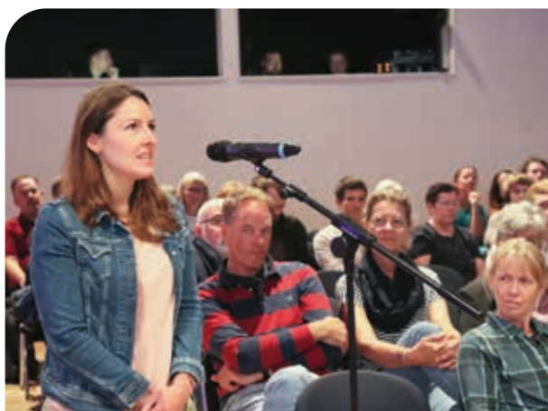
Eine Referendarin fragt nach den erschwerten Bedingungen im Referendariat.